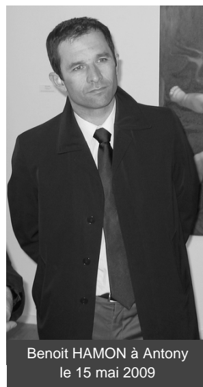
Benoît HAMON à Antony le 15 mai 2009

que toutes les personnes morales suspectes sont fiscalement transparentes. Ainsi l'Union européenne se dote d'un instrument puissant de lutte contre la fraude fiscale qui renvoie aux paradis fiscaux le soin de faire la preuve de leur conformité avec les exigences de l'Union en matière de transparence fiscale.